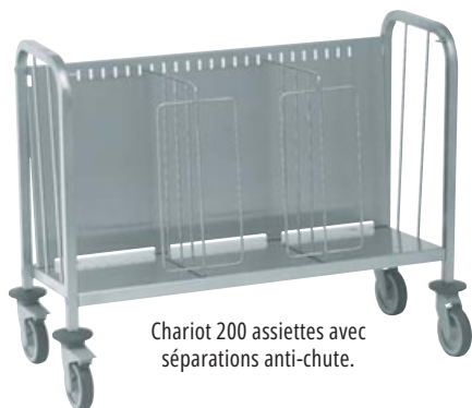
Chariot 200 assiettes avec séparations anti-chute.

Les chariots sont équipés de 4 roues pivotantes inoxydables à chape polyamide avec axe et billes inox. Le roulement à billes garantit la qualité du roulement et la bonne tenue dans le temps. Deux roues comportent des freins pour l'immobilisation des chariots. Le bandage des roues et les butoirs de protection sont non marquants.