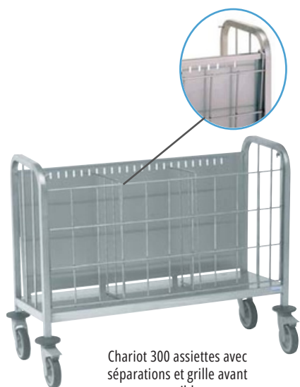
Chariot 300 assiettes avec séparations et grille avant amovible.