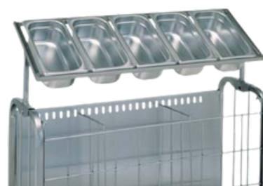
Distributeur à couverts réf. 800 571 (bacs en supplément)