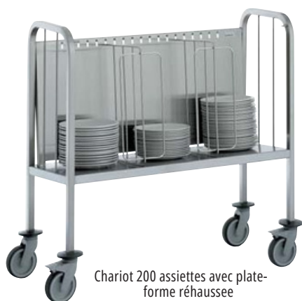
Chariot 200 assiettes avec plate-forme réhaussée